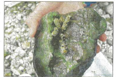
Die NMS Lunz bei der Untersuchung im Seebach. Oben rechts: Was sich unter Wasser alles tummelt: eine junge Bachforelle, eine Koppe und eine Eintagsfliege. Unten rechts: Auf seinem Stein entdeckt: ein sogenannter Steinköcher von Köcherfliegenlarven.